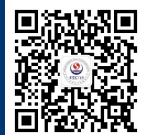
深大附中官方微信