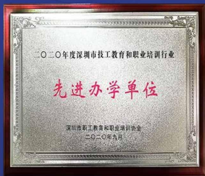
深圳市技工教育 先进办学机构