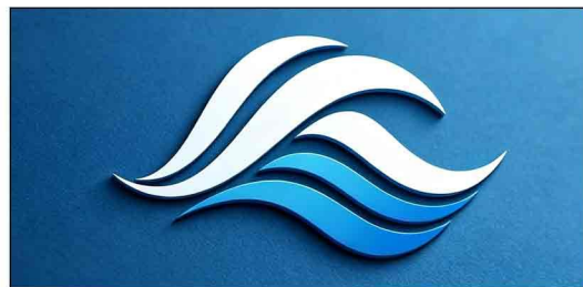
深圳水波传媒有限公司