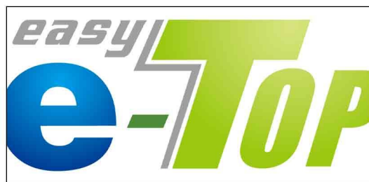
深圳市易通软件科技有限公司