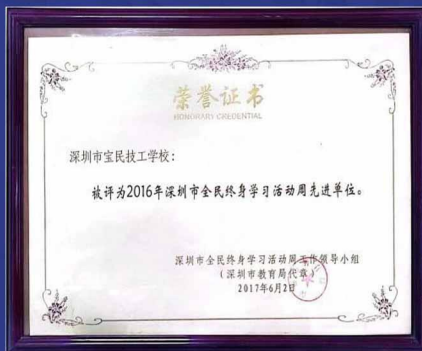
深圳市全民终身 学习活动周先进单位