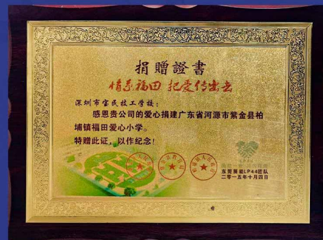
捐赠河源市紫金县 柏埔镇福田爱心小学