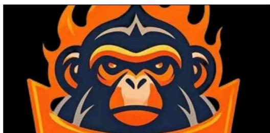
深圳烈火猴贸易有限公司